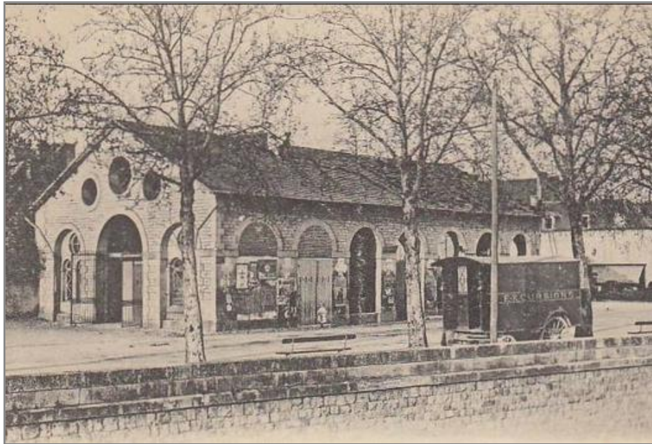
La halle, début du 20 ème siècle