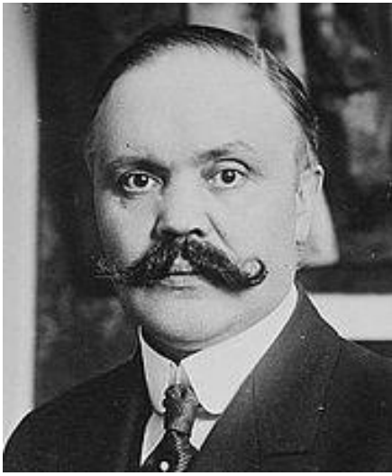
Louis Loucheur, député du Nord

En 1928, la loi Loucheur, qui prévoit la construction de 200 000 logements avec le concours financier de l'Etat, va relancer les efforts pour résoudre le problème du logement social, toujours aussi criant.