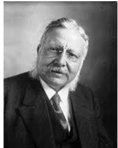
Laurent Bonnevey, député du Rhône

Le 11 juillet 1912 est votée la loi Bonnevey, qui instaure un véritable service public du logement social. Elle autorise la création des Offices d'habitations à bon marché, qui peuvent bénéficier de prêts de l'Etat à bas taux. Ces établissements autonomes permettent aux communes de construire ou d'aménager des bâtiments, de créer des cités-jardins et d'assainir des immeubles anciens. L'impact de la loi est réel et rapide, mais la première guerre mondiale ralentit bientôt l'application de ces dispositions.