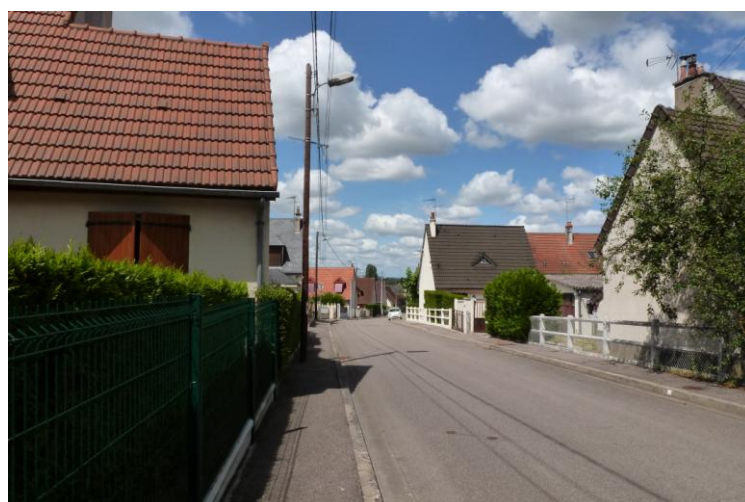
La cité du Gros Orme de nos jours