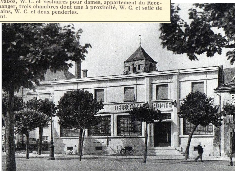
La Poste dans les années 1950