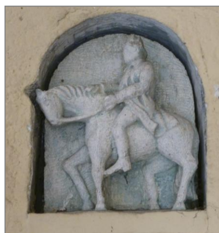
Deux sculptures visibles dans l'escalier de l'ancien relais de poste

A dater de la Révolution, la distribution du courrier est exploitée directement par l'Etat et les relais de poste continuent d'assurer le transport des voyageurs.