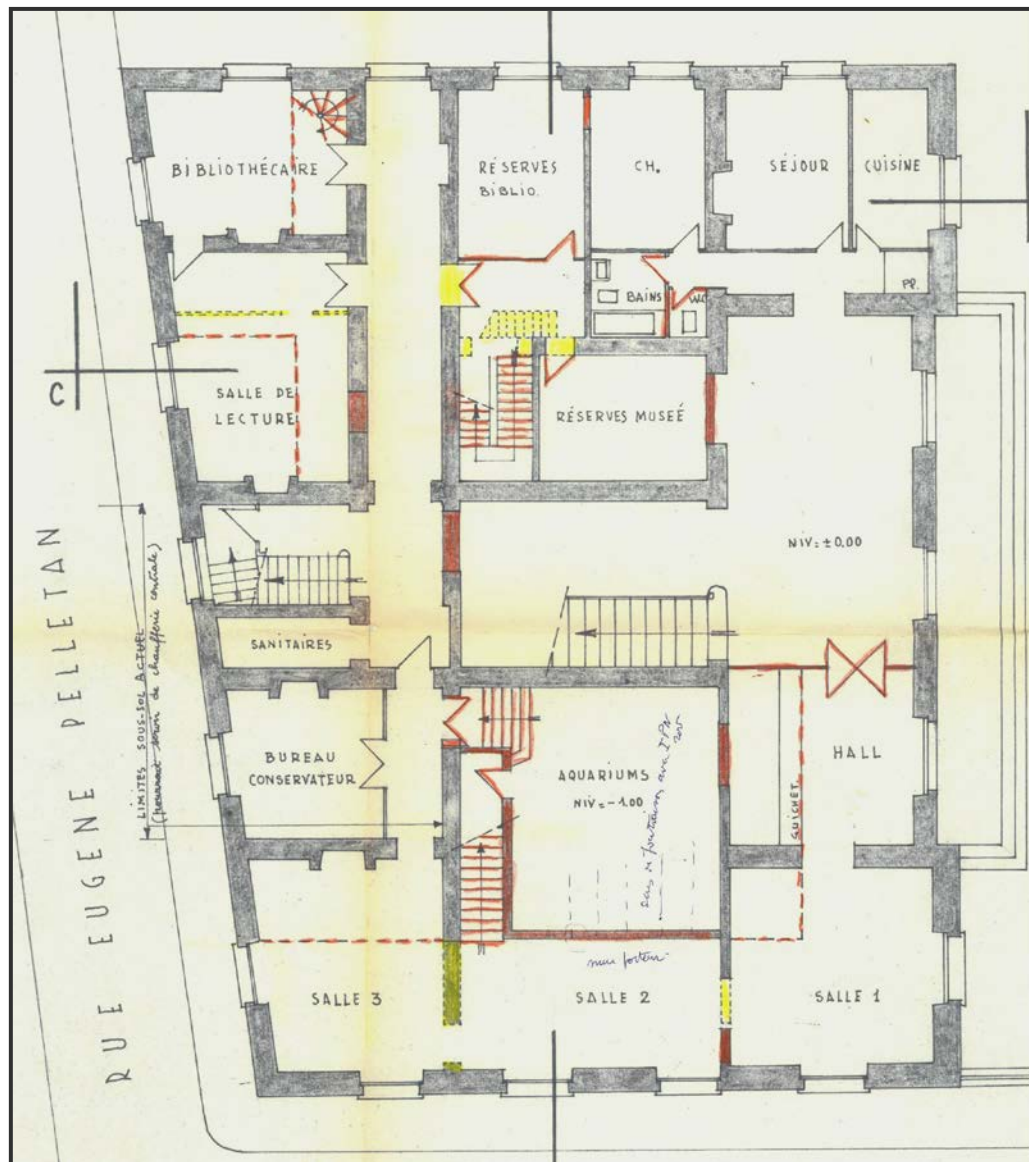
Projet d'aménagement de deux salles au rez-de-chaussée du tribunal, 1965

« La bibliothèque municipale, située vers l'est, comporterait une salle de lecture avec service de prêt et un bureau de bibliothécaire, avec réserves de livres au rez-de-chaussée et à l'entresol. La salle de lecture comporterait un balcon sur 2 de ses côtés pour permettre le dépôt de livres et une surveillance facile... Au rez-de-chaussée, afin d'avoir le maximum de réserves pour le musée de la Loire et la bibliothèque municipale, l'une des pièces servant de chambre au gardien lui sera supprimée. » Le déménagement est effectif en avril 1967.