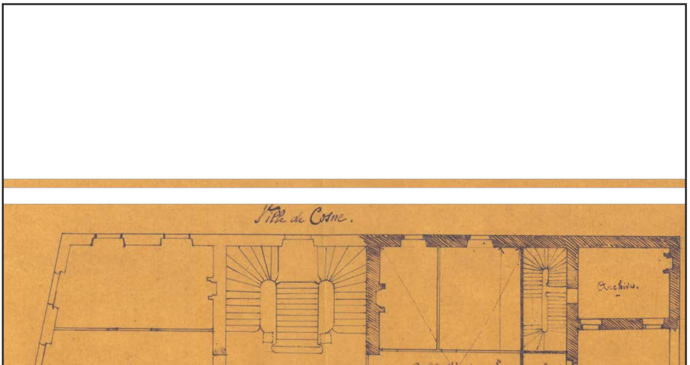
Plan d'aménagement de la bibliothèque, 1880

Le 21 septembre, est établi un devis estimatif des travaux à exécuter « pour la transformation de l'ancien logement de la directrice du télégraphe en bibliothèque, cabinet du bibliothécaire et salle des archives », au 1 er étage de l'hôtel de ville.