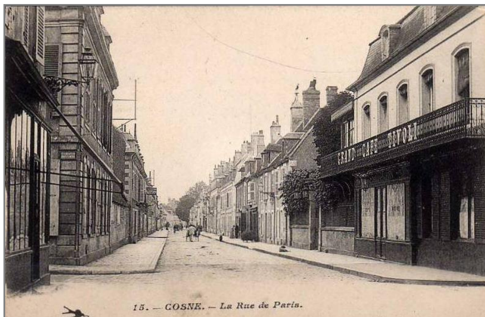
L'école de filles (à gauche de la photo) au début du 20 ème siècle