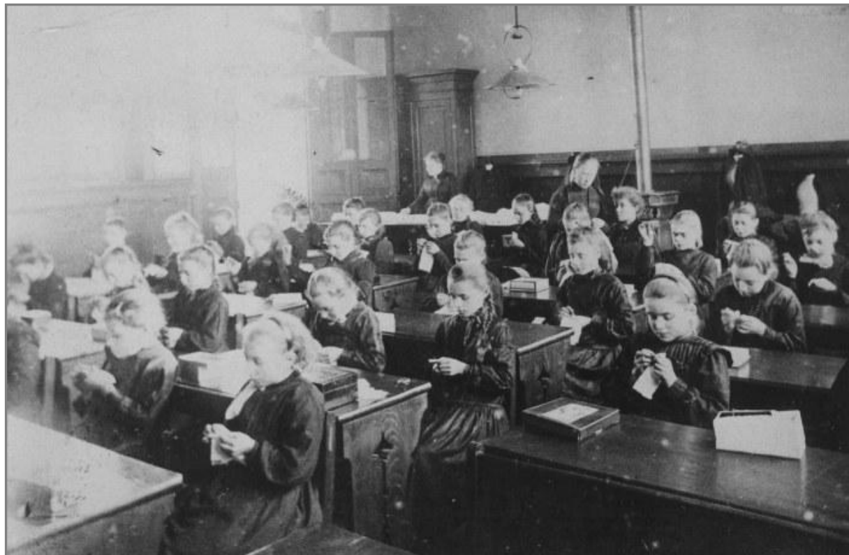
Leçon de couture dans une classe de filles à la fin du 19 ème siècle (1)

Le maire répond « que l'instruction est donnée gratuitement aux garçons, qu'il n'en est point de même pour les filles qui, à l'exception d'un petit nombre fréquentant ce qu'on appelle la classe des pauvres, sont obligées de payer leurs leçons ; qu'il y a lieu de faire cesser cette inégalité. » Le projet est encore ajourné.