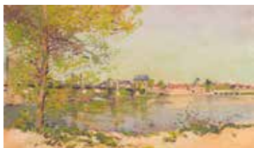
Albert Dardy, Bords de Loire, vue de la ville de Cosne , 1910, Huile sur bois, 68.6 x 91.7 cm Coll. Musée de la Loire, COP 958.3.1

Avis aux peintres, aquarellistes, dessinateurs, graveurs... ! Vous êtes un artiste amateur ou confirmé, vous êtes sensible à la nature, au paysage, vous avez la volonté de travailler en plein-air, d'après nature... le musée de la Loire vous invite à participer à la première Semaine des paysagistes.