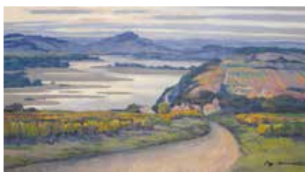
Rex-BARRAT, Vue de la côte des Loges à Pouilly , huile sur toile, vers 1945, COP 1102, © Musée de la Loire