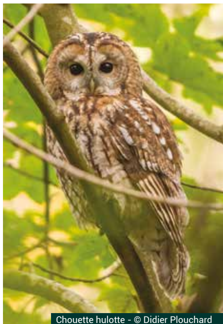
Chouette hulotte

N'hésitez pas à contacter la LPO-BFC pour nous faire part de la présence de ces rapaces nocturnes dans vos propriétés.