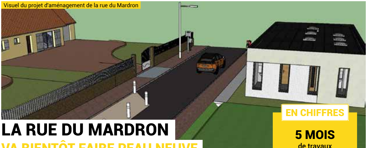
Visuel du projet d'aménagement de la rue du Mardron

Des travaux seront réalisés à la fin de l'année 2024 sur le côté du Vieux Château, à l'emplacement des maisons détruites, afin d'aménager un square. Des bancs et des plantes y seront installés afin d'agencer un espace agréable.