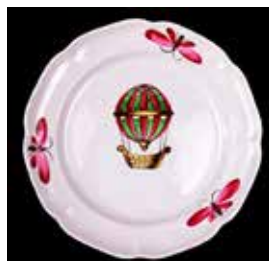
Assiette à la montgolfière, vers 1785, faïence de petit feu, Manufacture de Strasbourg, © Musée de la Loire, COF 970.1.66

Jeudi 25 juillet, à 18h Gratuit, réservation obligatoire au 03.86.26.71.02