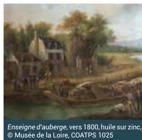
Enseigne d'auberge, vers 1800, huile sur zinc, © Musée de la Loire, COATPS 1025

Les dimanches 21 juillet et 18 août, à 10h Gratuit, verre pour la dégustation 5 € Réservation obligatoire au 03.86.26.71.02