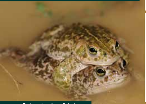
Bufo calamita

Beaucoup moins connu que le Crapaud commun, il s'en distingue par sa ligne dorsale claire et son iris jaune. D'aspect assez trapu et robuste, avec une tête aplatie, il dépasse rarement les 9 cm de long. Le corps est verruqueux brun-clair marbré de vert. Il possède à l'arrière des yeux de grosses glandes parotoïdes produisant du venin pour dissuader ses prédateurs.