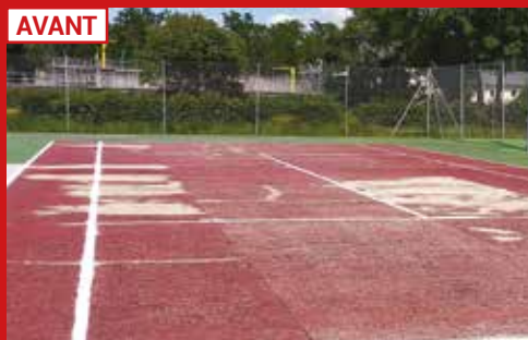
REMISE EN ÉTAT DES COURTS EXTÉRIEURS