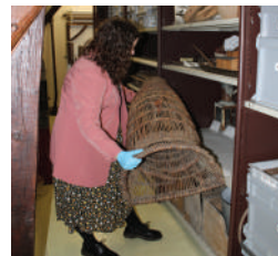
Récolment des objets d'arts et traditions populaires