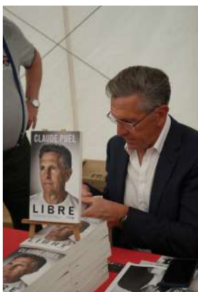
Les dédicaces se sont enchaînées tout au long du week-end pour Claude Puel et les auteurs

Rencontres, dédicaces, conférences, expositions et animations... toutes les personnalités présentes ont joué le jeu pendant ces 3 jours durant lesquels la littérature s'est installée au cœur de la cité Ligérienne. Depuis 35 ans, le Salon partage la passion et l'amour de la lecture... un rendez-vous culturel et annuel incontournable pour tous les amoureux de littérature !