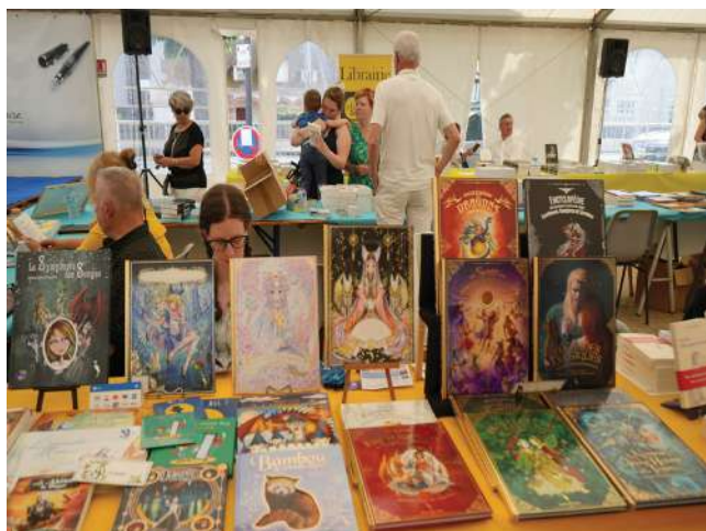
Le Salon fait aussi la part belle aux bandes dessinées