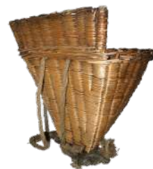
Hotte de vigneron, 20 ème siècle, collection du Musée de la Loire, Ville de Cosne

Le musée de la Loire vous offre l'opportunité exceptionnelle de vous glisser quelques instants dans la peau d'un régisseur. Après les arts graphiques en mars, les peintures en avril, l'ethnographie et les arts décoratifs seront à l'honneur, l'occasion de venir découvrir des objets rarement montrés au public et conservés dans le secret des réserves. Cette visite sera suivie d'une mise en pratique durant laquelle vous pourrez vous imprégner concrètement du métier de régisseur en récolant une œuvre d'art.