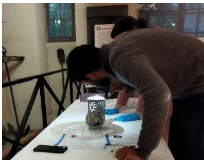
Constat d'état de l'œuvre à son arrivée au musée